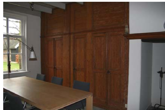
Kasten links van de schouw