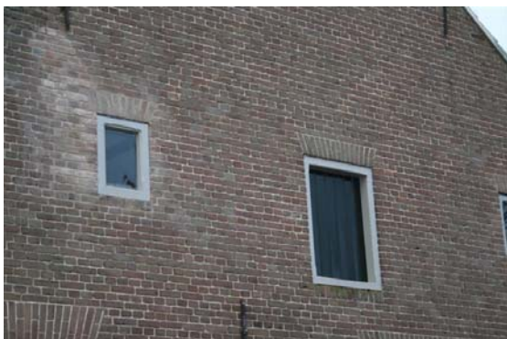
Detail verdieping voorgevel