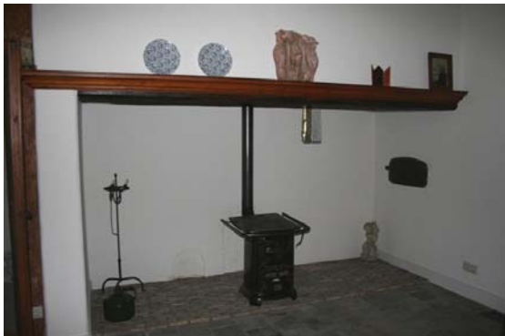
Schouw in de herd

Ook de stal is bereikbaar via de keuken. Hoewel het stalgedeelte van vlak na de Tweede Wereldoorlog dateert, heeft het een klassieke indeling. De koeien stonden vooraan in de grupstal, waarna de paarden, varkens en karren volgden. De zolder werd gebruikt voor opslag. In de koeienstal is een viertal betonnen pilaren aanwezig, waarop betonnen balken rusten. Tussen de balken bevindt zich een gemetseld plafond. De wanden zijn gecementeerd en geschilderd. Op de zolder zijn vijf gebinten aanwezig. Tegen de brandmuur staan een kachel en een waterketel.