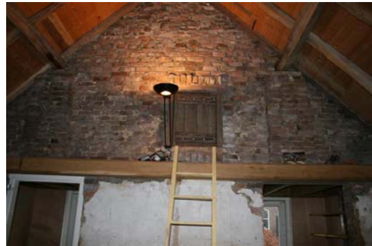
Binnenzijde oude rechterzijgevel