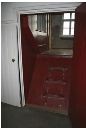
Trapje naar de opkamer