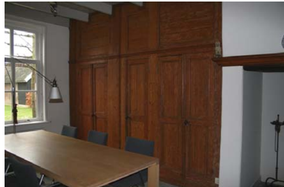
Kasten links van de schouw