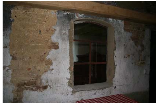
Binnenzijde oude linkerzijgevel